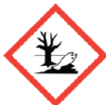
Pericoloso per l'ambiente