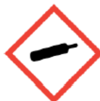
Gas in pressione